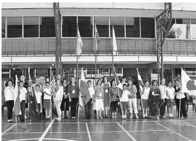
2016 年カンファレンス