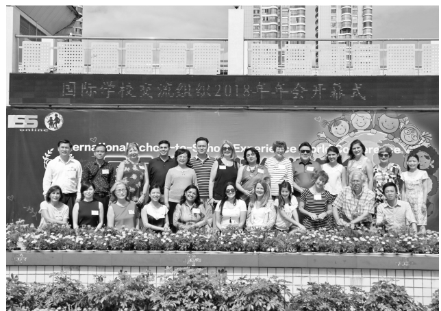
2018 年カンファレンス