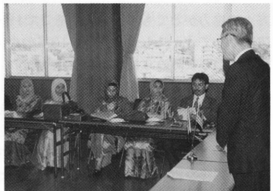
▲市長表敬訪問 マレーシア