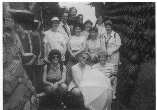
▲オーストラリア教師団 ジャパンスタディーツアー