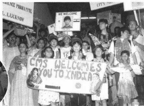
▲常東小派遣団 インド訪問 シティーモンテソーリ小学校